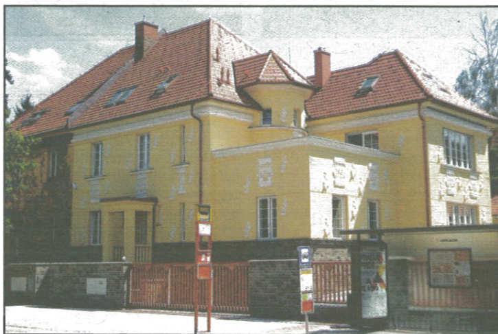
Budova kubánského velvyslanectví na pražské Ořešince.